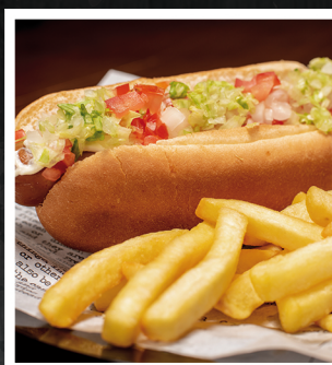
Hot Dog CENTRAL PARK